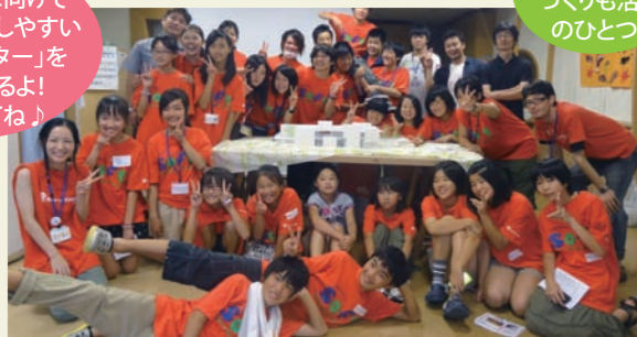
▲「THEローリング・ストーンズ〜俺等はそれをROCKと呼ぶんだぜ!〜」長いグループ名だけど、石=ロック、巻=ロールで「ロックンロール」。

石巻の復興に向けて みんなが過ごしやすい 「子どもセンター」を つくっているよ! みんな来てね!