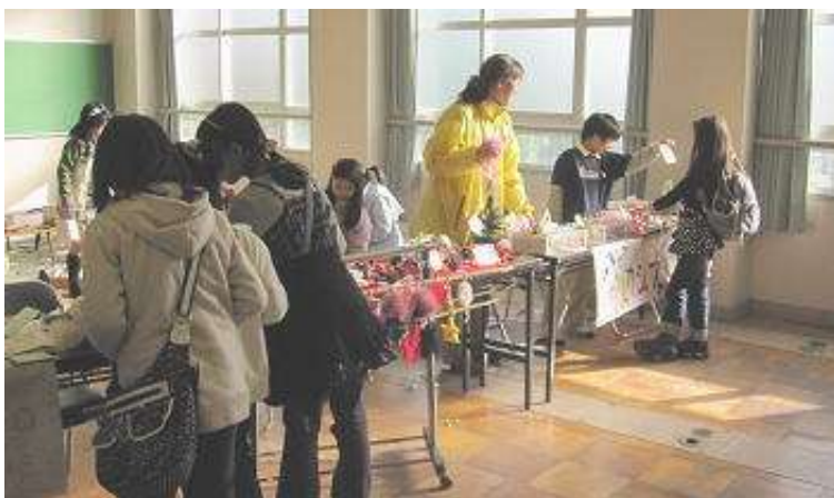
「手作りショップ」 どれを買おうか迷っちゃう…