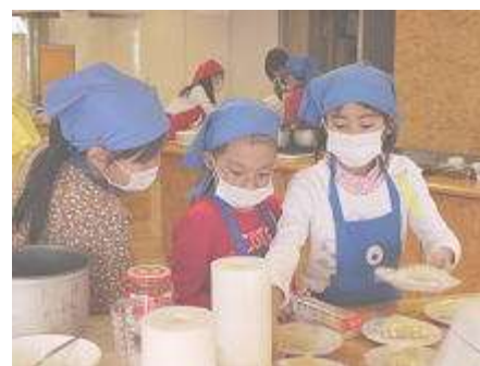
「レストラン」 ケーキを作っています